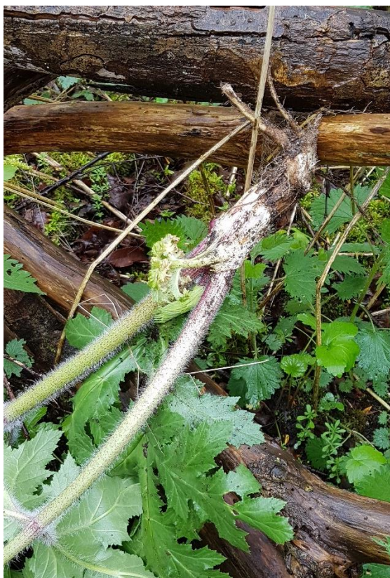
Rodstikken kæmpebjørneklo lagt på grene

Korrekt rodstikning slår planten ihjel, og den kommer ikke igen. Med en skarp spade stikkes roden over 10-15 cm under jordoverfladen. Ved en effektiv/korrekt rodstikning får man kappet roden under