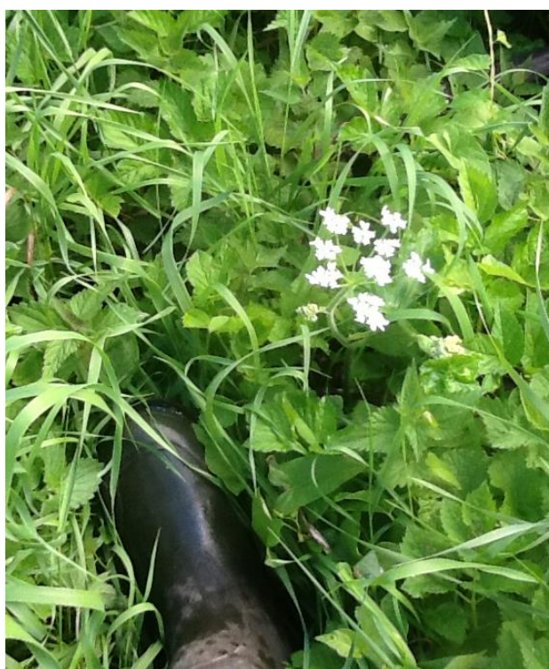
Panikblomst af kæmpebjørneklo i lav højde.

Kolding Kommune accepterer kun kapning af skærme som bekæmpelsesstrategi efter nærmere aftale på bestande, hvor dette er hensigtsmæssigt. Det kan for eksempel være, hvis det er umuligt at rodstikke eller på meget store forekomster.