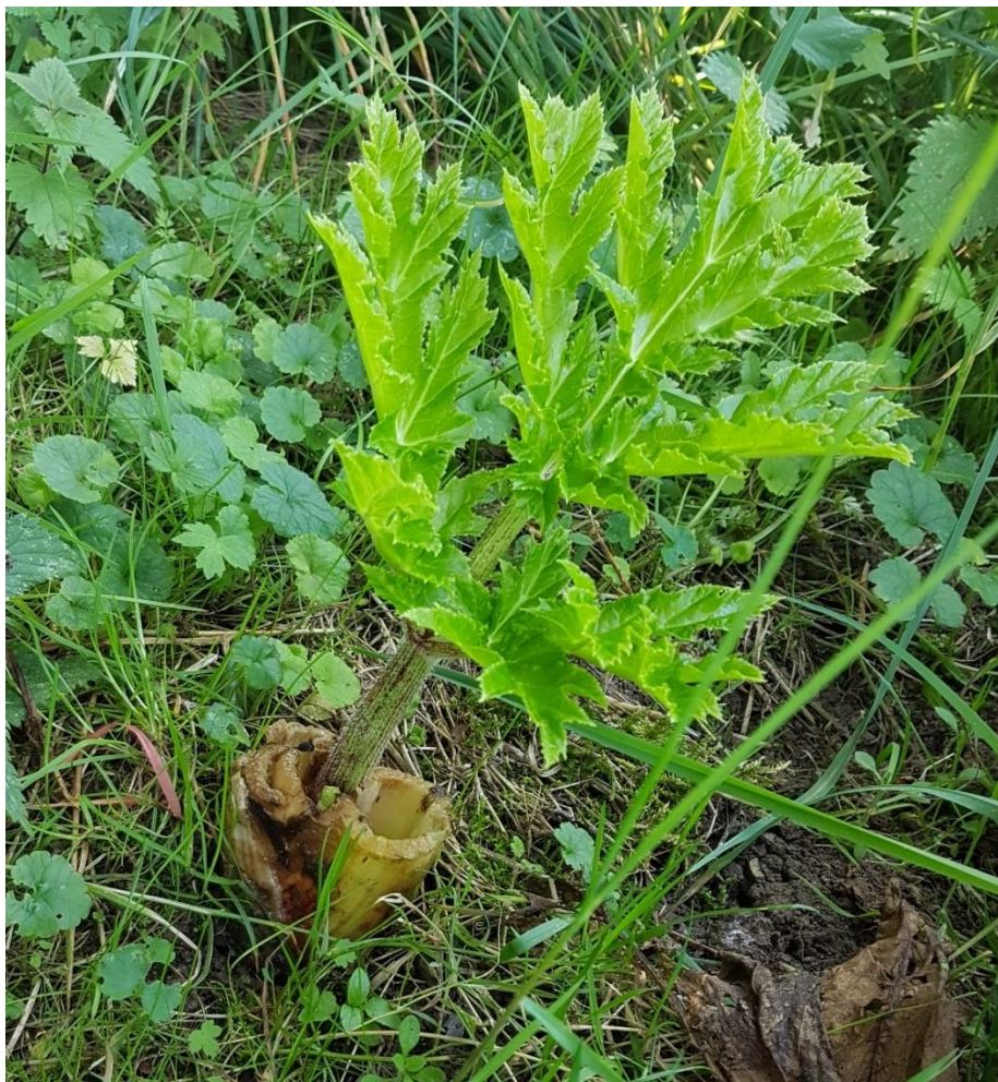
Kæmpebjørneklo skyder igen efter slåning.