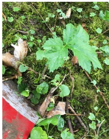
Stor kimplante af kæmpebjørneklo