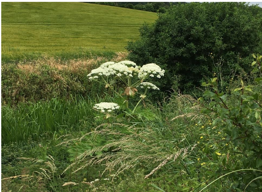
Kæmpebjørneklo i blomst

Blomsterne er hvide og sidder i skærme i toppen af stænglen. Blomstringen sker i juni-august. De grønne frugter (frø) dannes fra juni/juli, hvorefter de modner og bliver brunlige. I gennemsnit sættes 20.000 frø pr. plante. Frøene kan ligge i jorden i mange år og vente på, at forholdene bliver de rigtige til at spire