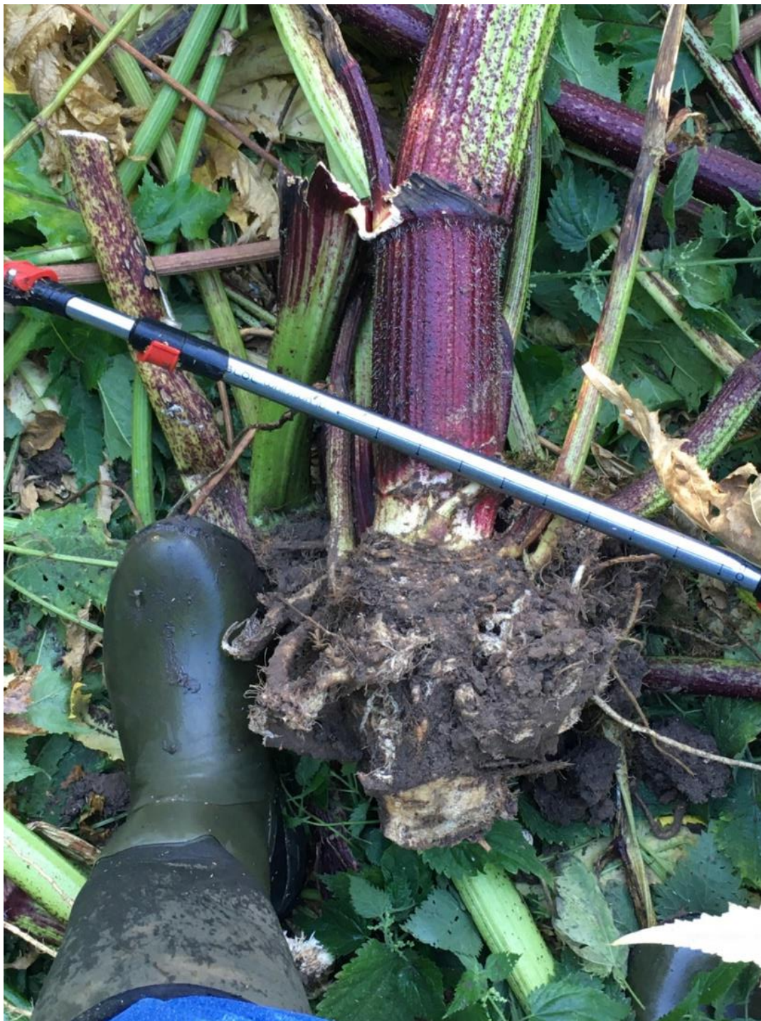
Gammel kæmpebjørneklo er rodstukket. Der er 5 cm mellem mærkerne på pinden.