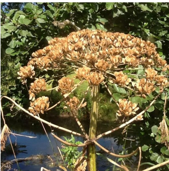
Frøskærm på kæmpebjørneklo.

Kæmpebjørneklo har en cyklus, hvor den dør, når den har smidt frø. Hvis planten bliver holdt nede ved for