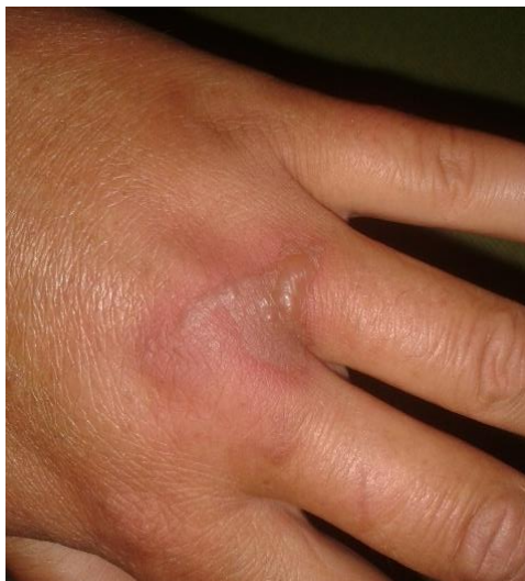
Vabel fra saft af kæmpebjørneklo dagen efter hånden blev ramt.

Saften fra kæmpebjørneklo kan give voldsomt, eksem-lignende udslæt, der ligner og føles som store brandvabler. Det bliver rigtig slemt, hvis huden oveni udsættes for sollys. Hvis man har fået saften på sig, er førstehjælpen straks – helst inden for 20 minutter - at vaske huden med vand og sæbe. Desuden skal man undgå sollys på det ramte sted. Det kan tage lang tid, før sårene heler igen, og huden kan i flere år efterfølgende være sart og reagere på sollys. Solcreme med høj faktor beskytter til en vis grad mod reaktionen med sollys.