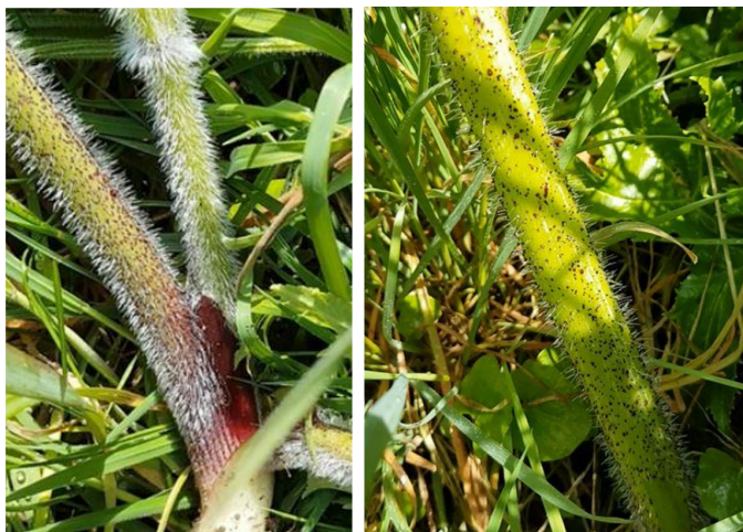
Stængelen på unge kæmpebjørneklo er håret og har røde pletter

Kæmpebjørneklo er en skærmpolante, som kan blive op til fem meter høj med flere meter lange blade. Stængelen er furet, typisk håret og med rødlige pletter. Nyspirede planter har runde blade, men disse bliver efterhånden takkede, og fuldt udviklede blade er håndfligede og stærkt takkede.