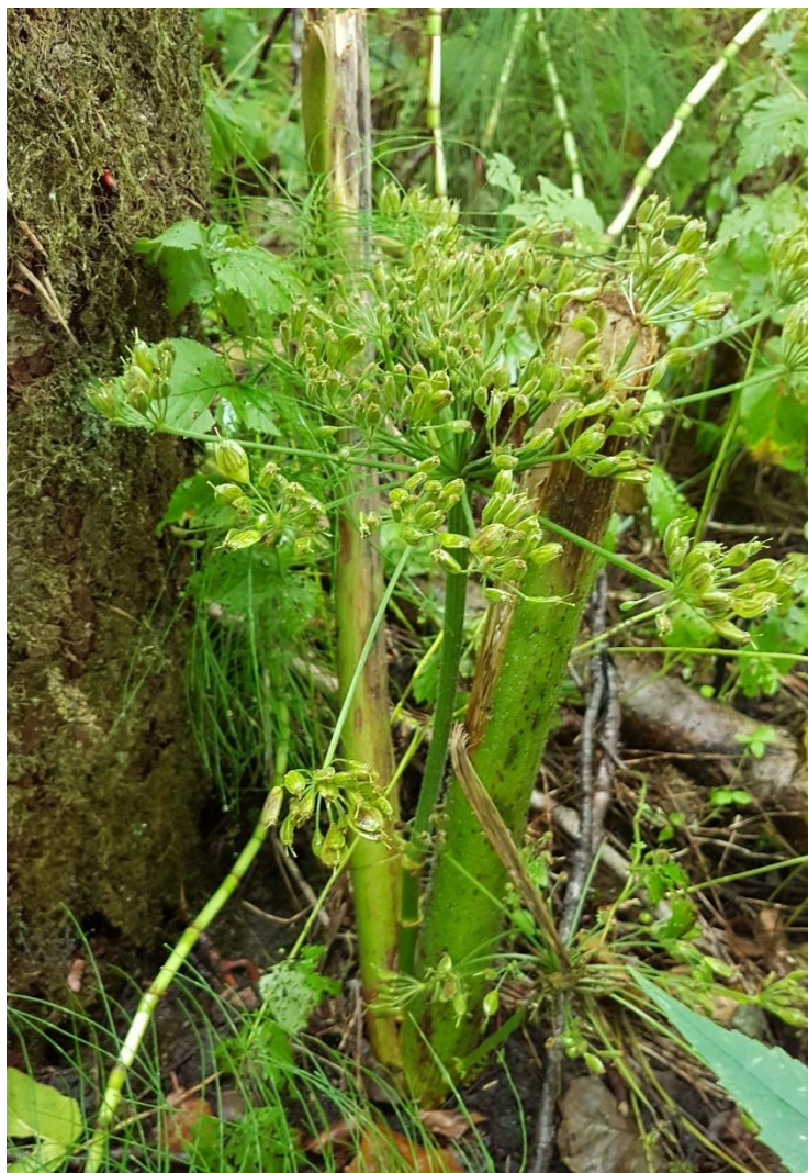
Kæmpebjørneklo har været slået af, nu har den sat en ny lavtsiddende skærm med frø.