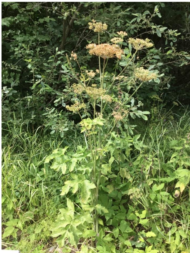
Almindelig bjørneklo med frøstande

Kæmpebjørneklo forveksles ofte med almindelig bjørneklo ( Heracleum sphondylium ), som også har hvide