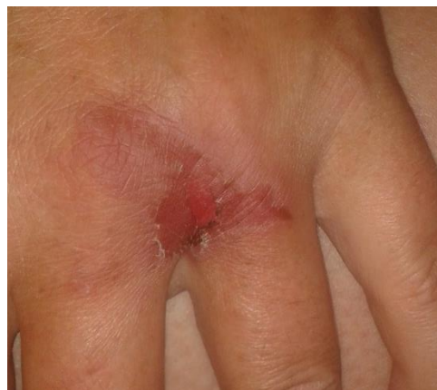
Samme hånd tre dage senere.

Det bedste er at bekæmpe kæmpebjørneklo i foråret, inden planterne bliver for høje. Så er risikoen for at få saft på huden ikke så stor. Man bør selvfølgelig have lange bukser på, og også handsker hvis man skal have fat i kæmpebjørneklo. Hvis planterne er blevet store, bør der bruges beskyttelsesudstyr som handsker, regntøj og visir. Husk at vaske redskaber med varmt vand og sæbe og få tøjet vasket.